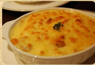
海老のマカロニグラタン ¥1,260