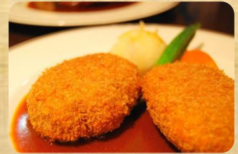
じゅん特製メンチカツレツ ¥1,260