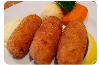
たらば蟹のクリームコロツケ ¥1,380