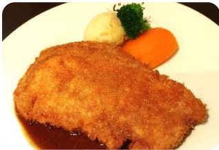
和豚ポークカツレツ ¥1,260