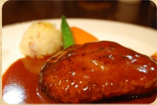
特製ハンバーグ ドミグラスソース ¥1,260