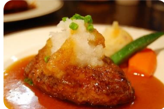
特製ハンバーグ 和風おろしソース ¥1,260