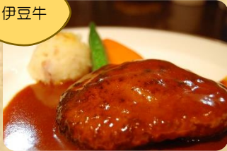
特製ハンバーグ ドミグラスソース