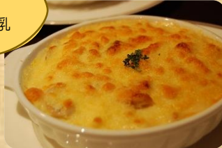
海老のマカロニグラタン