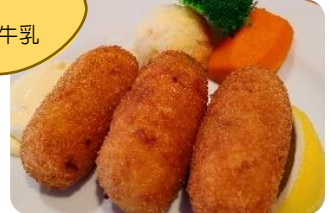
かにクリームコロッケ