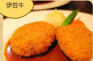
じゅん特製メンチカツレツ