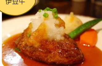
特製ハンバーグ 和風おろしソース